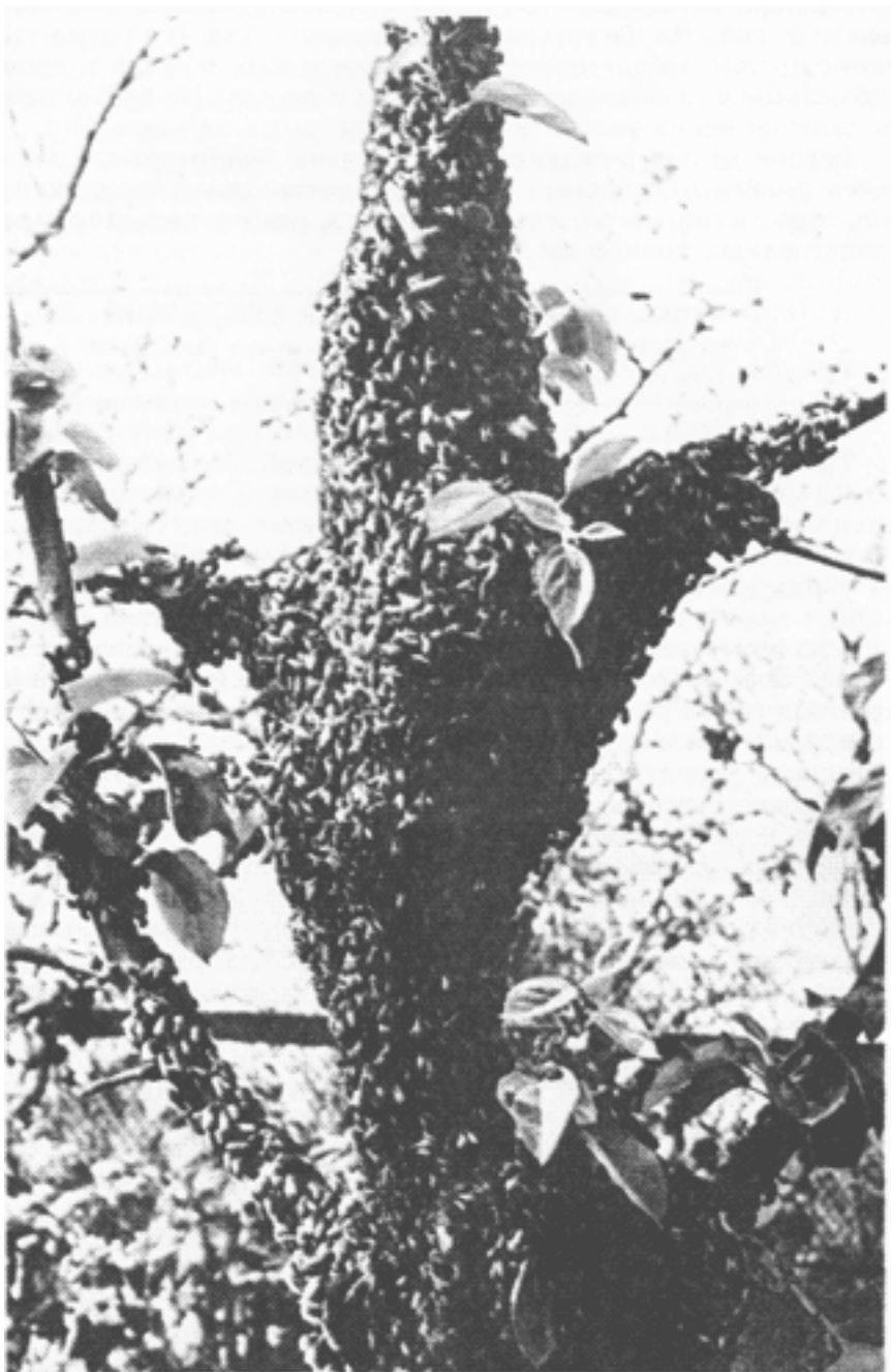
Рой. В нем десятки тысяч пчел. И все они родные сестры

Правда, не всегда, особенно в беслесных местах, рои заранее отыскивает себе подходящее жилье. Но он все равно улетает с пасеки. Где-нибудь он садится, чтобы передохнуть, вновь высылает пчел-разведчиц, и так до тех пор, пока не обоснуется на постоянное жительство.