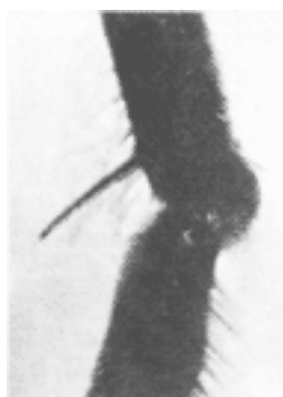
Отросток-шпорце, которым пчела снимает пыльцевую обножку с корзиночки

Основная масса пыльцы идет на корм личинкам, которые без белка пыльцы развиваться не могут. Не случайно самое большое количество расплода бывает в период массового сбора пыльцы. Личинка пчелы очень быстро растет. И не только потому, что ей обильно скармливают пчелиное молочко, но и потому, что она поедает пыльцу, богатую белками, гормонами и ростовыми веществами, усиливающими функции организма. Белок не только усваивается личинкой, но и накапливается в виде так называемого жирового тела, необходимого для превращения во взрослое насекомое.