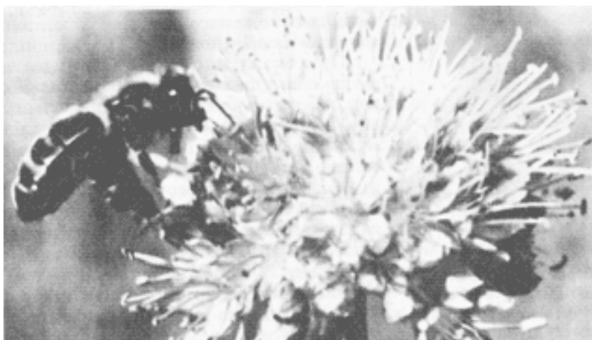
Пчела на лету формирует обножку

За пыльцой пчелы летают обычно в первой половине дня, когда она имеет максимальную влажность. Каждая пчела посещает какой-то один из видов пыльценосов. Обножка одноцветна и очень редко бывает смешанной.